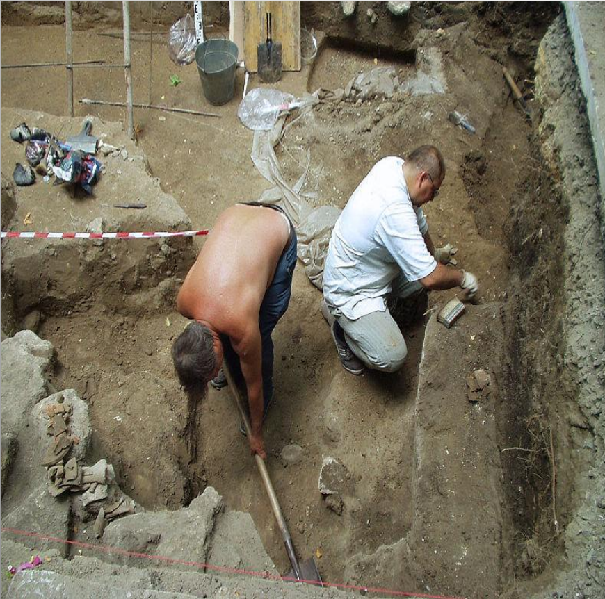
Obrázek č. 8