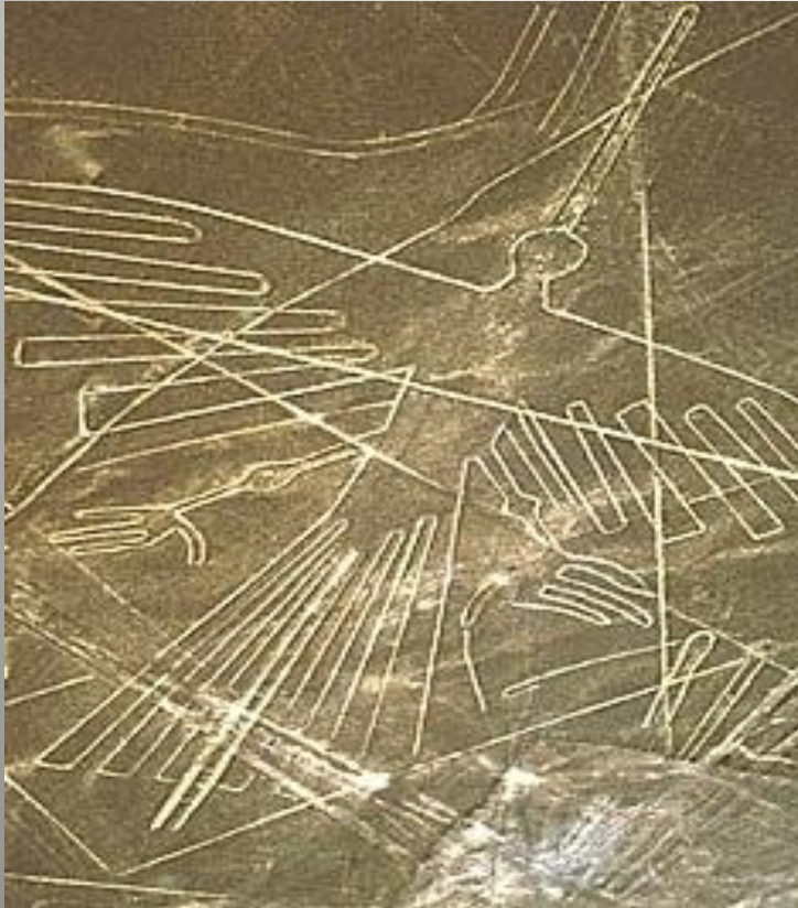
Obrázek č. 6