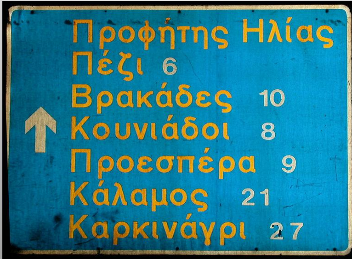
Obrázek č. 1