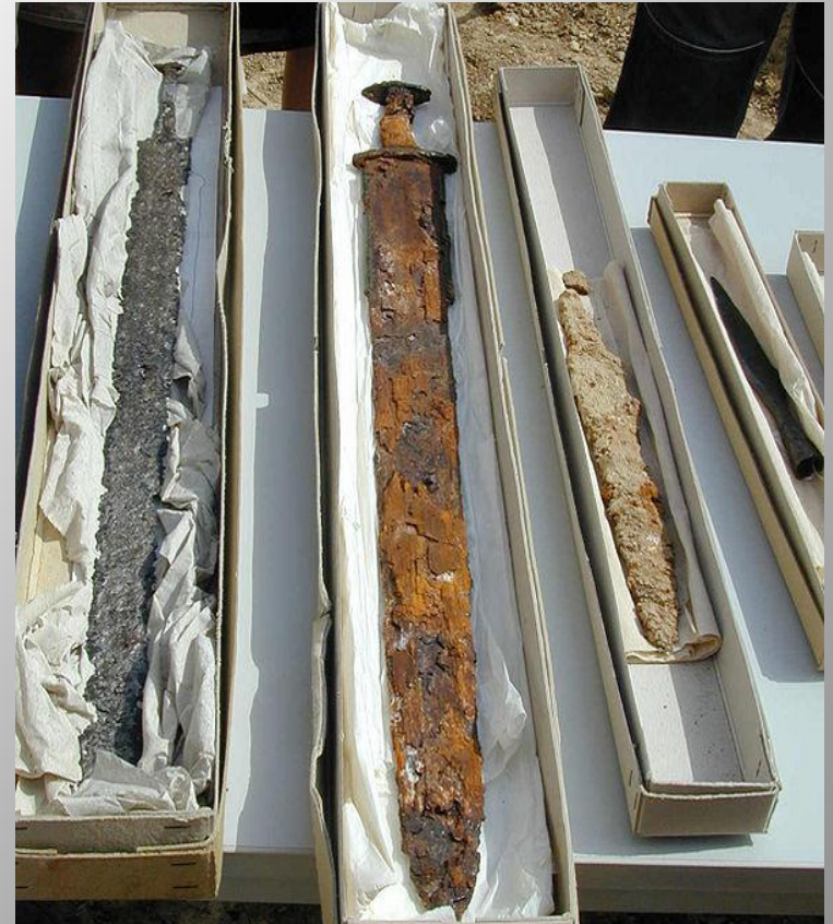
Obrázek č. 9