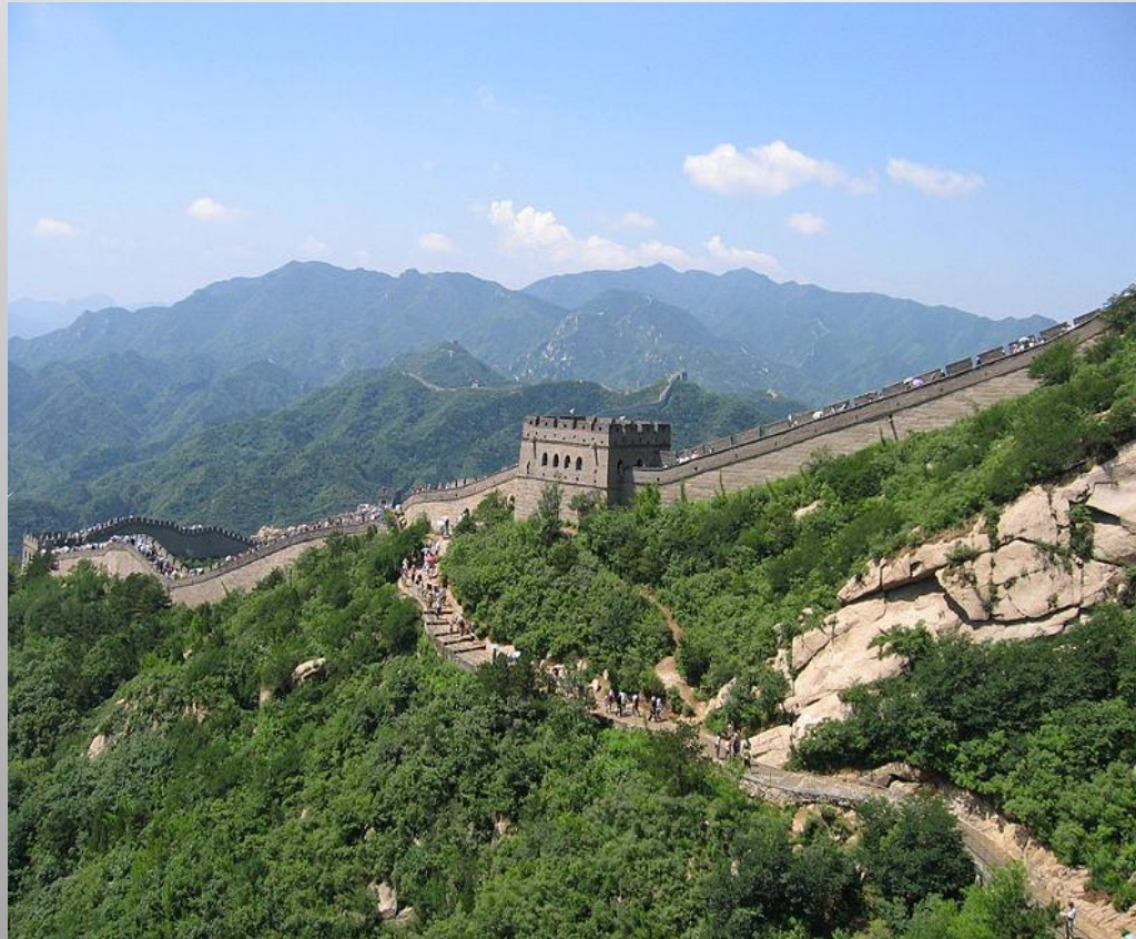
Obrázek č. 8