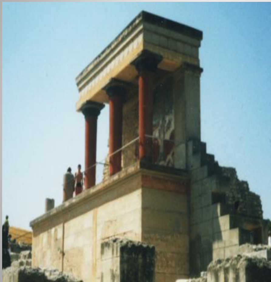
Obrázek č. 4