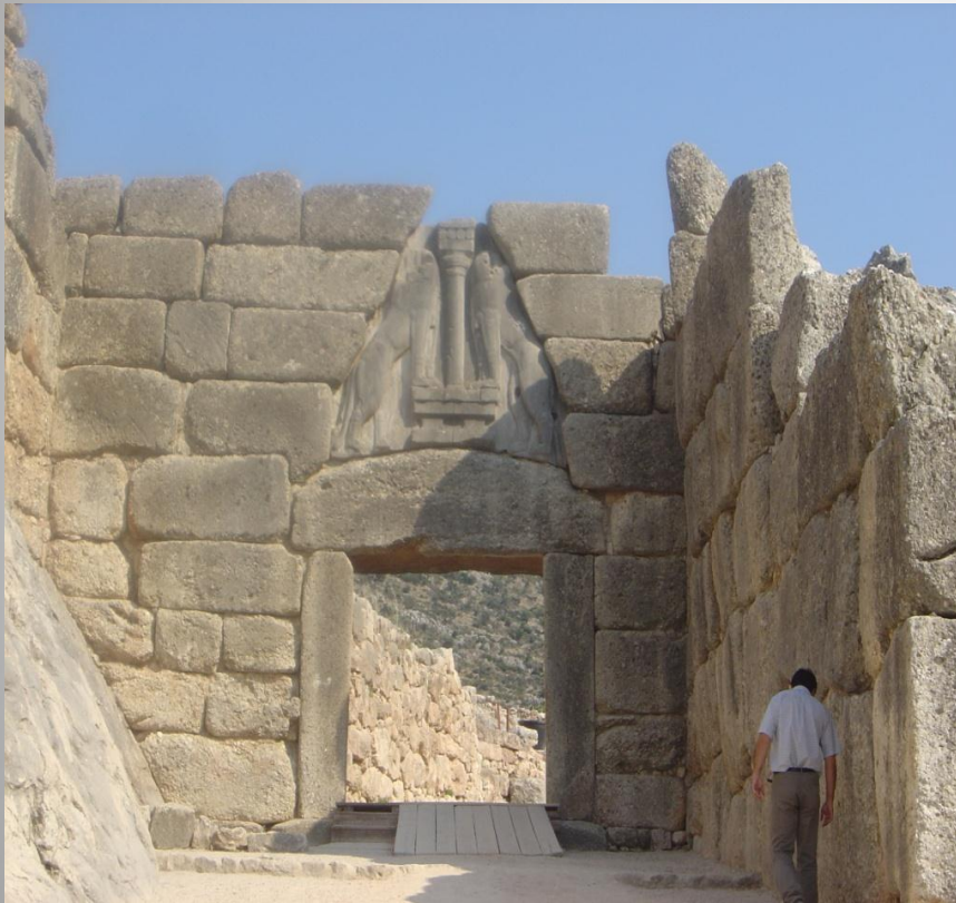
Obrázek č. 5 Lví brána v Mykénách