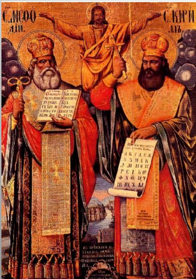
Ikona zobrazující sv. Cyrila a Metoděje