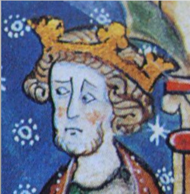
Jan Bezzemek – král Anglie a Irska (1199 – 1216)