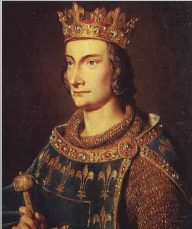
Filip IV. král Francie (1285 – 1314)