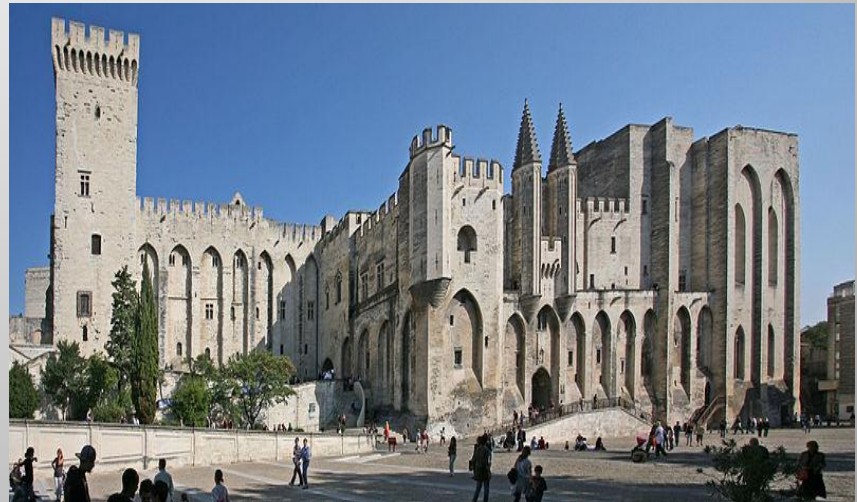
Papežský palác v Avignonu Avignonské zjetí papeže (1309 – 1378) Filip IV. chtěl z papežství vytvořit vlastní mocenský nástroj.