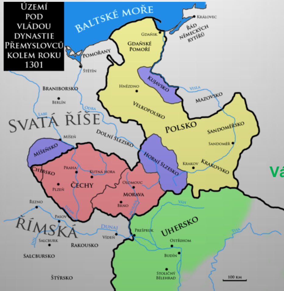
Obrázek č. 12

České království Polské království Pravděpodobný rozsah moci Václava III. v Uhrách Země v lenní závislosti