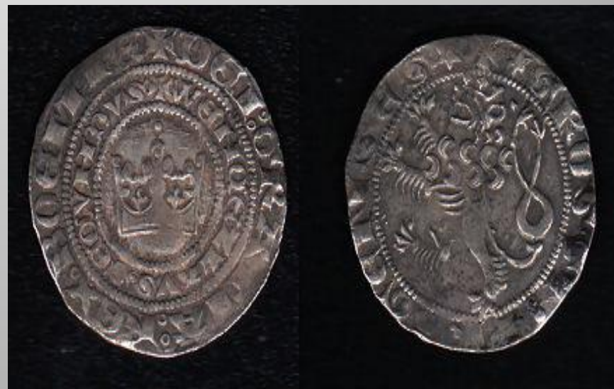
Pražský groš Václava II.