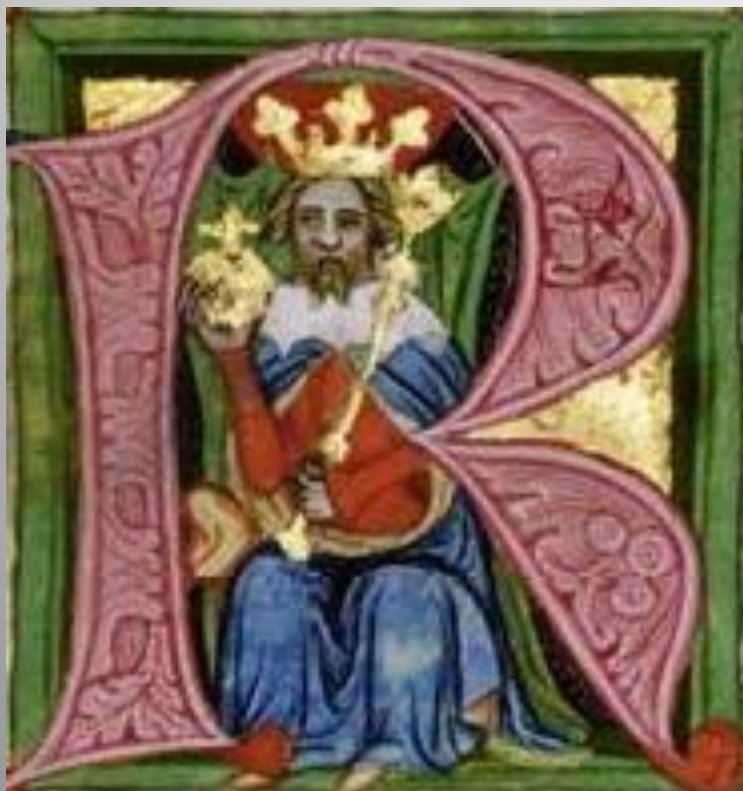
Miniatura ve Zbraslavské kronice, 14. stol.