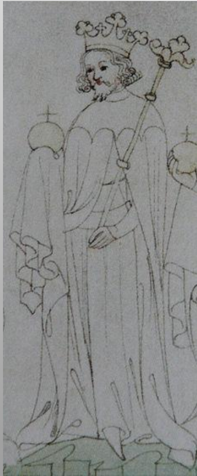
Král železný a zlatý, 15. stol. Zbraslavská kronika