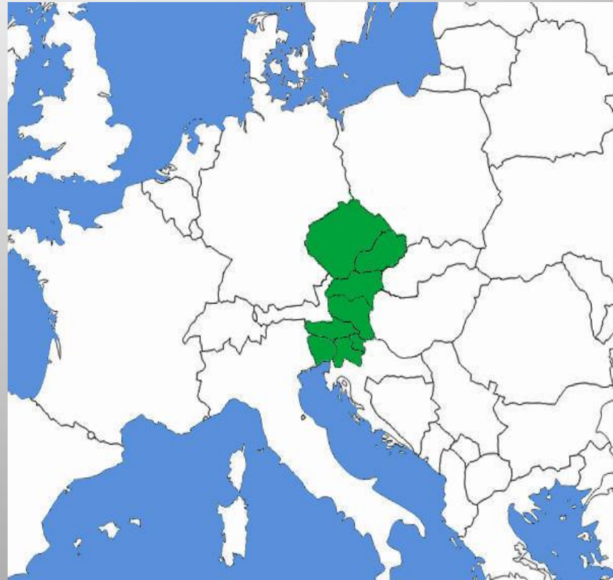
Území Přemysla Otakara II.