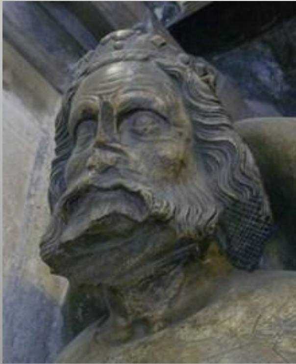
Detail Přemyslova náhrobku od Petra Parláře, pochován v Katedrále sv Víta.