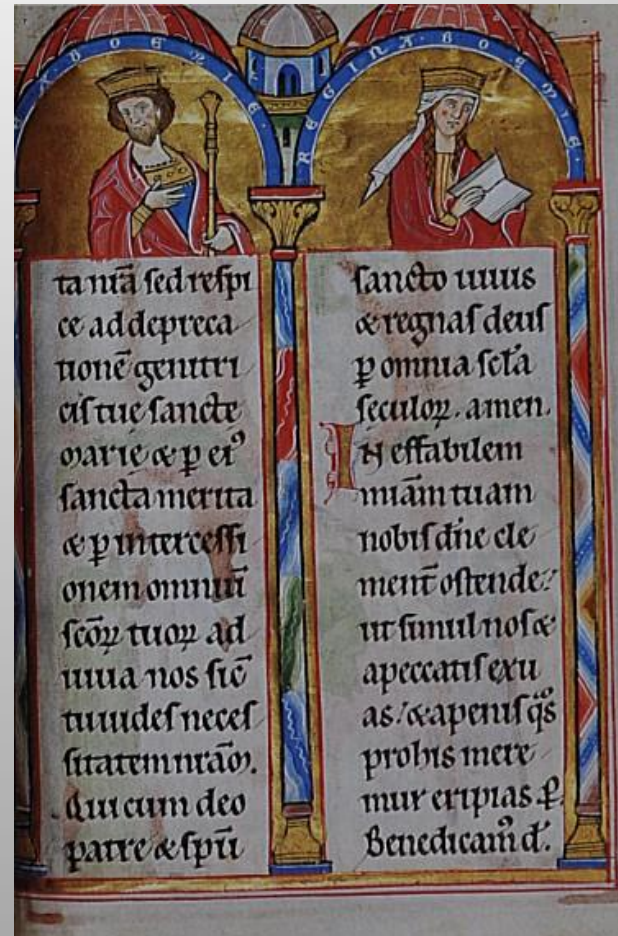
Přemysl Otakar I. a Konstancie Uherská na dobové iluminaci z 13. stol. (Žaltář Heřmana Durynského)