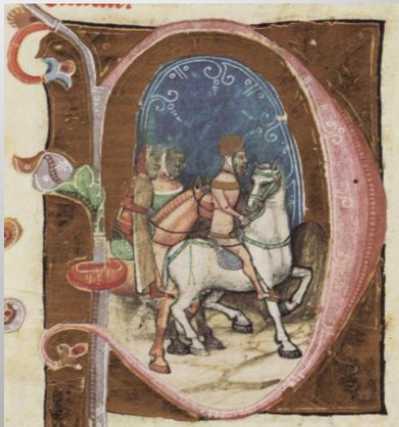
Václav III. na cestě do Uher (Chronicon Pictum)