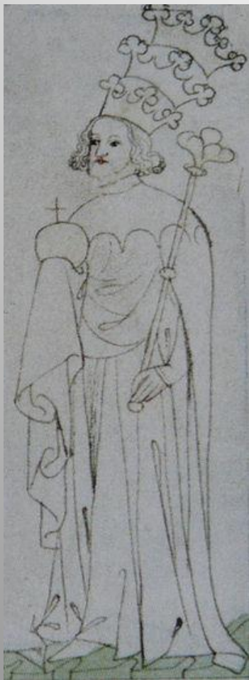
Obrázek č. 13