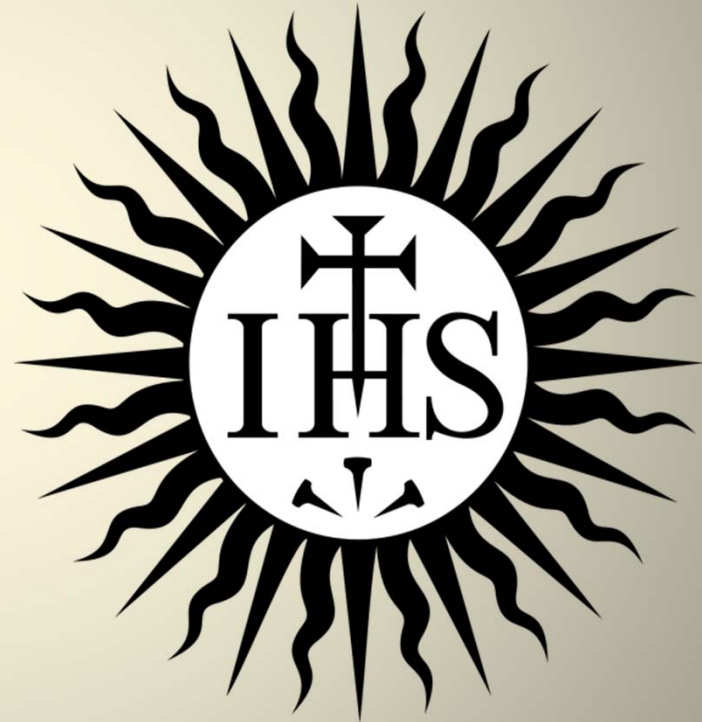
znak jezuitského řádu