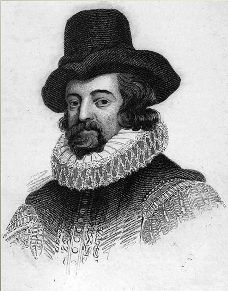
Obrázek č. 4

Francis Bacon se narodil v rodině sira Nicholase Bacona, lorda strážce pečeti. Jeho rodina pocházela z tzv. nové šlechty. Byl geniální dítě, v mládí pochopil, že je potřeba reformovat vědu. Stal se členem parlamentu (1584). Byl rádcem Alžběty I. a později krále Jakuba I. Pomáhal řídit Spojené království Anglie a Skotska. Byl obviněn z údajné korupce a uvězněn v londýnském Toweru. Poslední léta se věnoval práci na filozofických spisech.