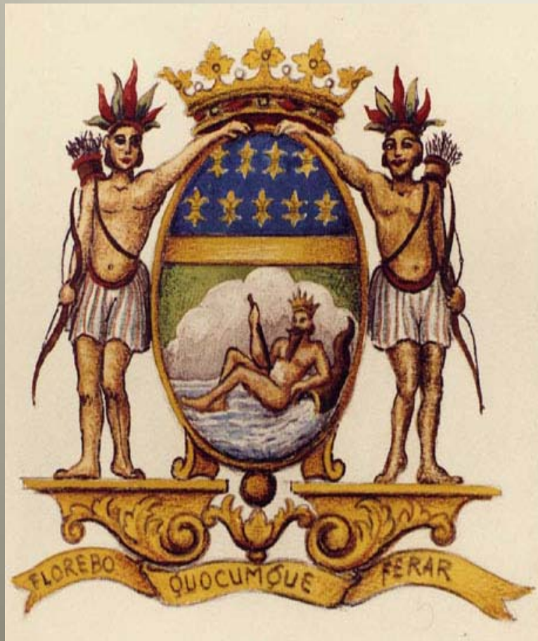
znak Východoindické společnosti