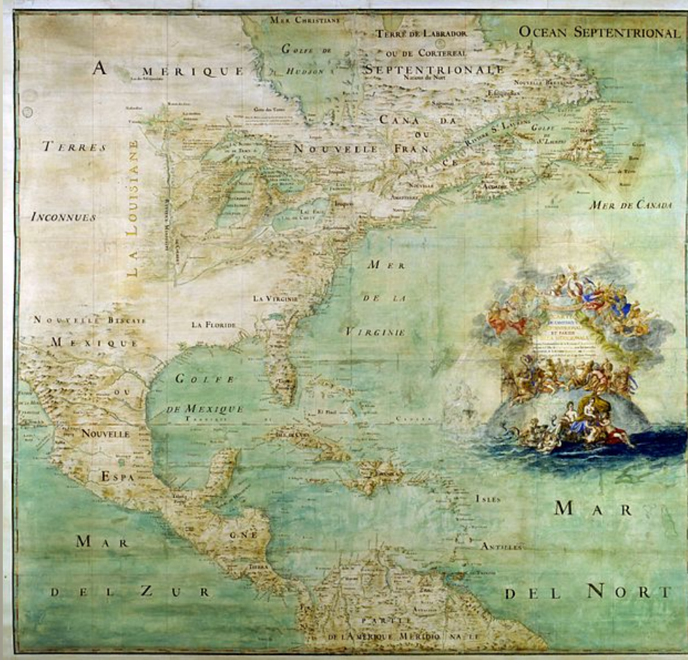
Mapa francouzského osídlení v Severní Americe z roku 1681