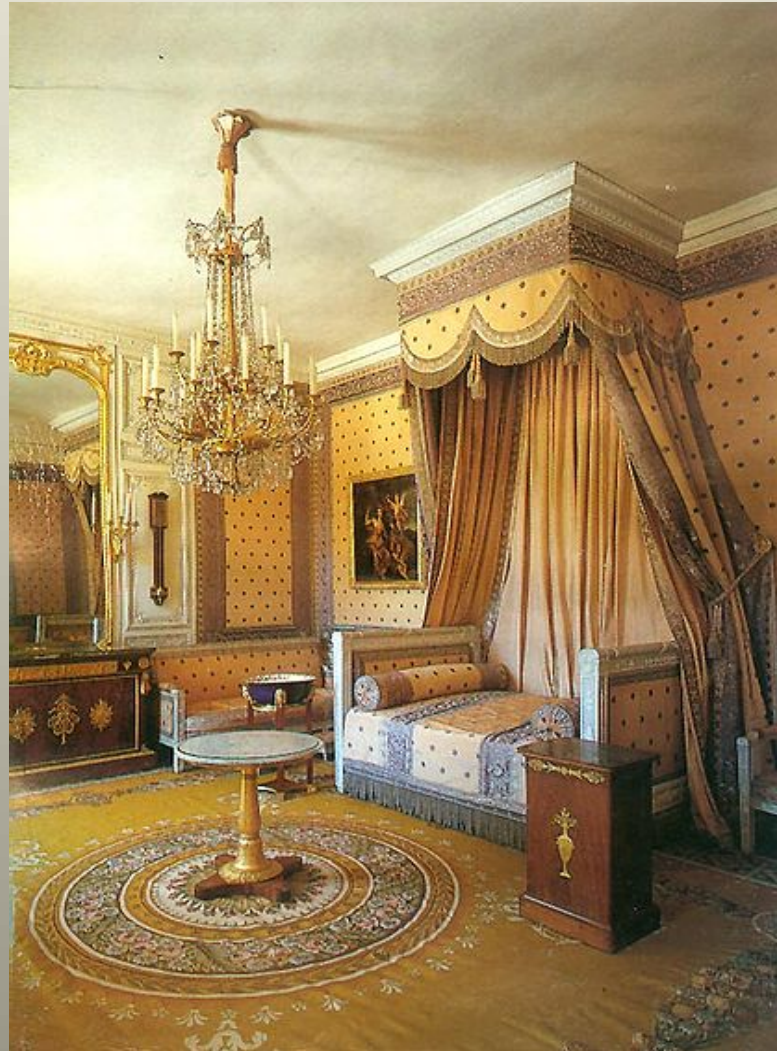
Obrázek č. 3