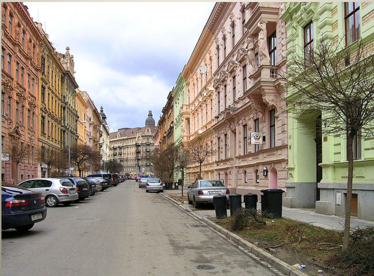
Obrázek č. 6