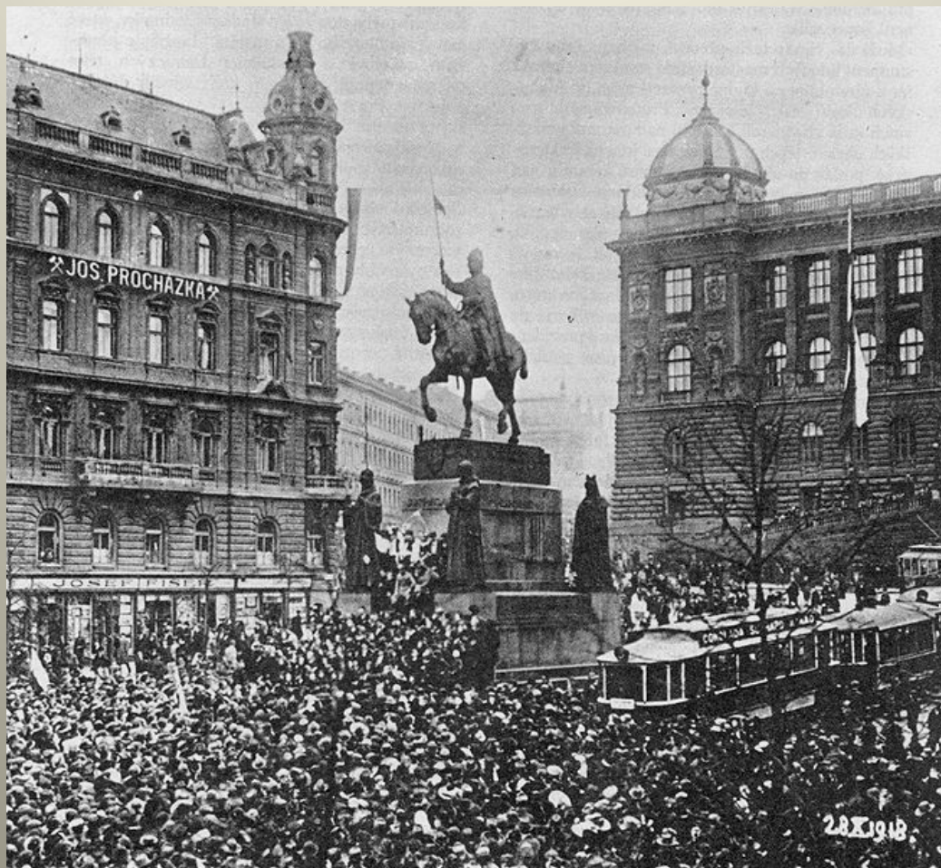
Obrázek č. 9