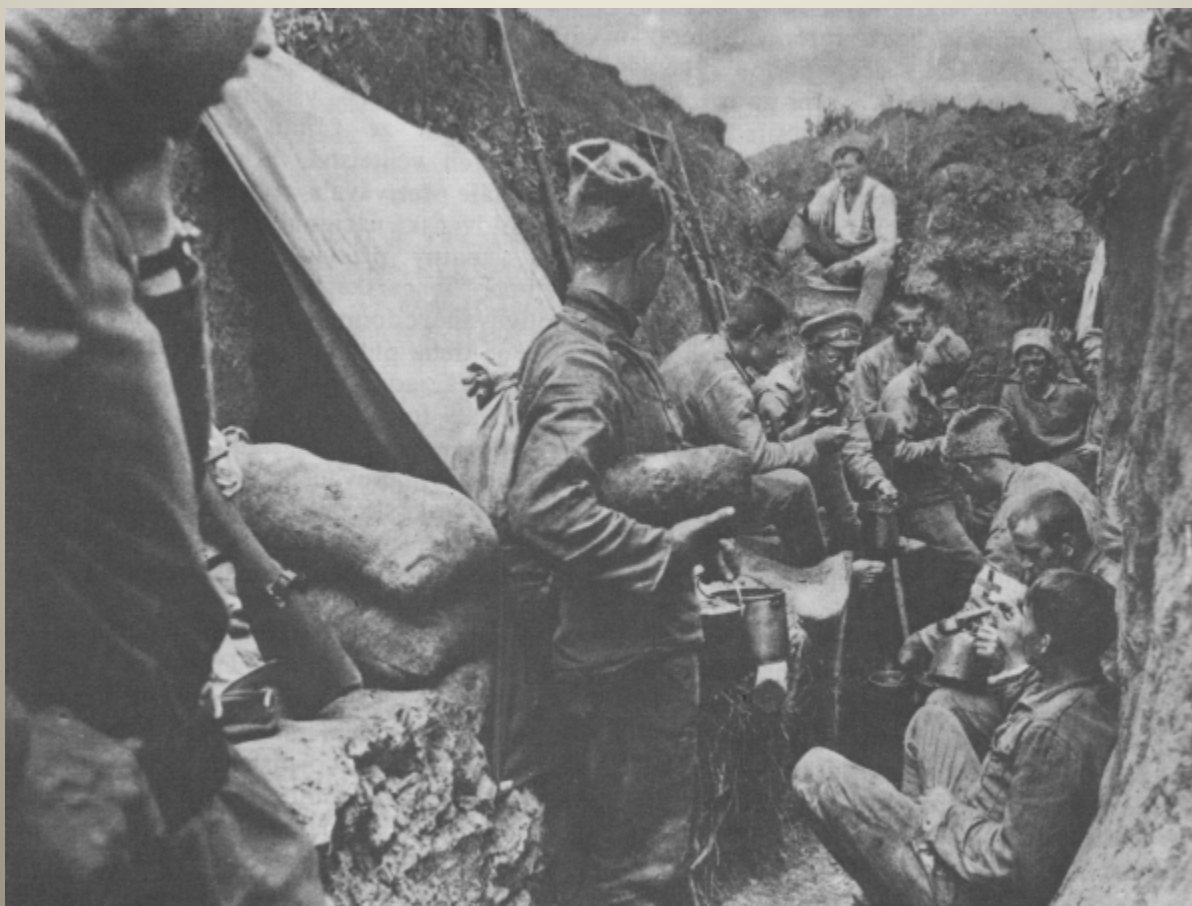
Obrázek č. 6