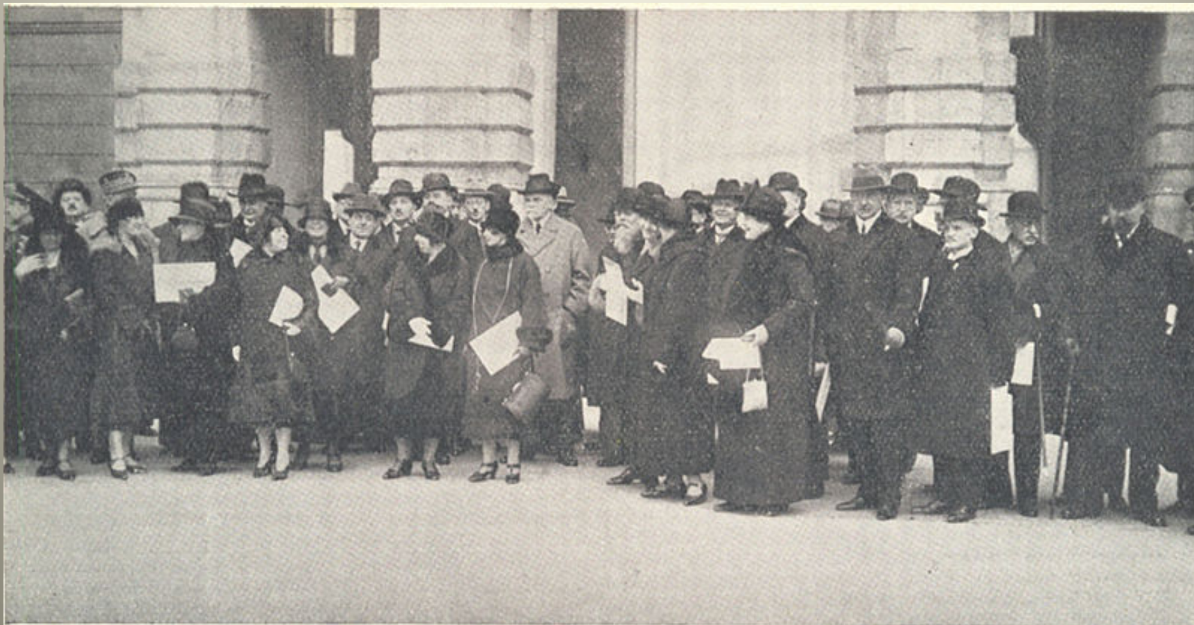
Členové mafie po obdržení revolučních medailí na Hradě pražském.