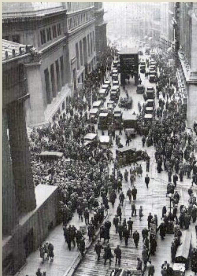
Obrázek č. 8