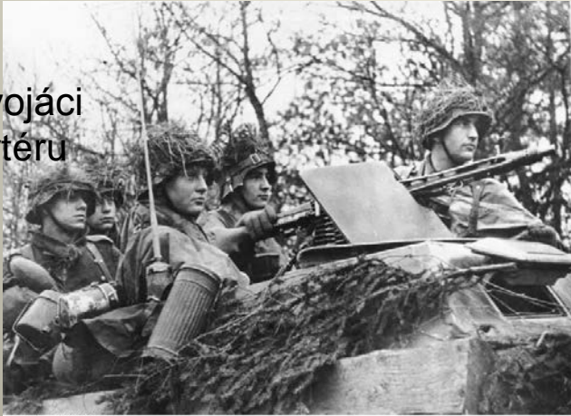
Obrázek č. 8