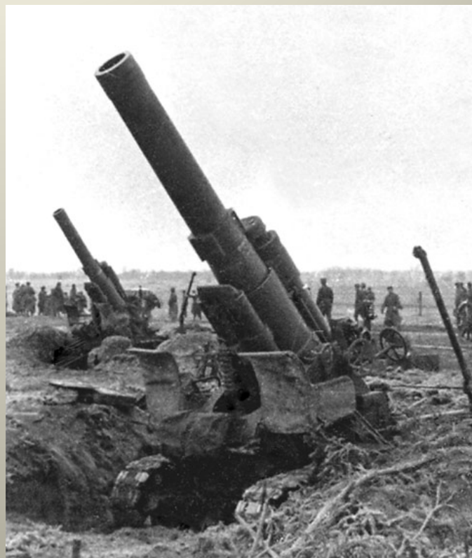
Obrázek č. 6

Sovětské houfnice 3. běloruského frontu v palebných postaveních, léto 1944.