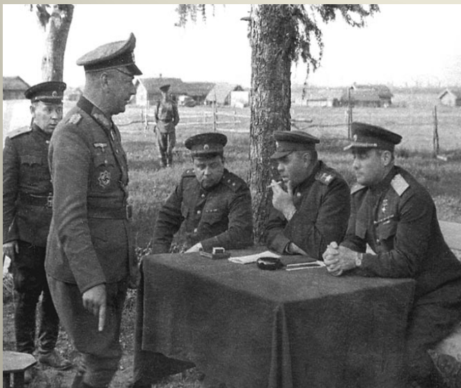
Obrázek č. 5

Generál pěchoty Friedrich Gollwitzer kapituluje před generálem Čerňakovským a generálplukovníkem Vasilevským po bitvě o Vitebsk.