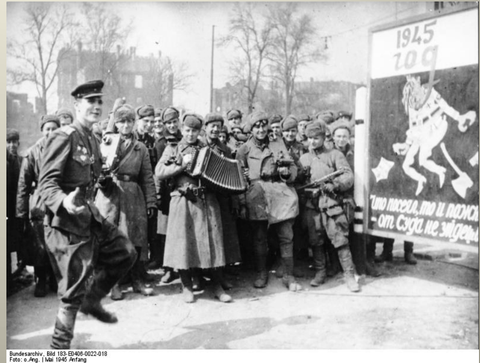
Vojáci Rudé armády v ulicích Berlína květen 1945

Úkol: Kdy skončila definitivně 2. světová válka?