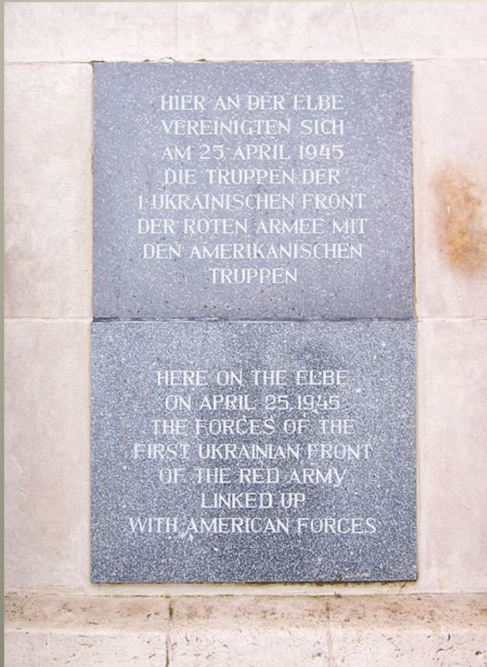
Pamětní deska v Torgau na Labi, kde „Východ potkal Západ“ (25. dubna 1945)