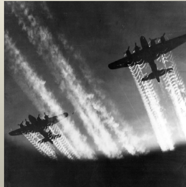
Obrázek č. 3

Od poloviny roku 1942 působilo kromě britské RAF v Evropě americké letectvo ( USAAF ).