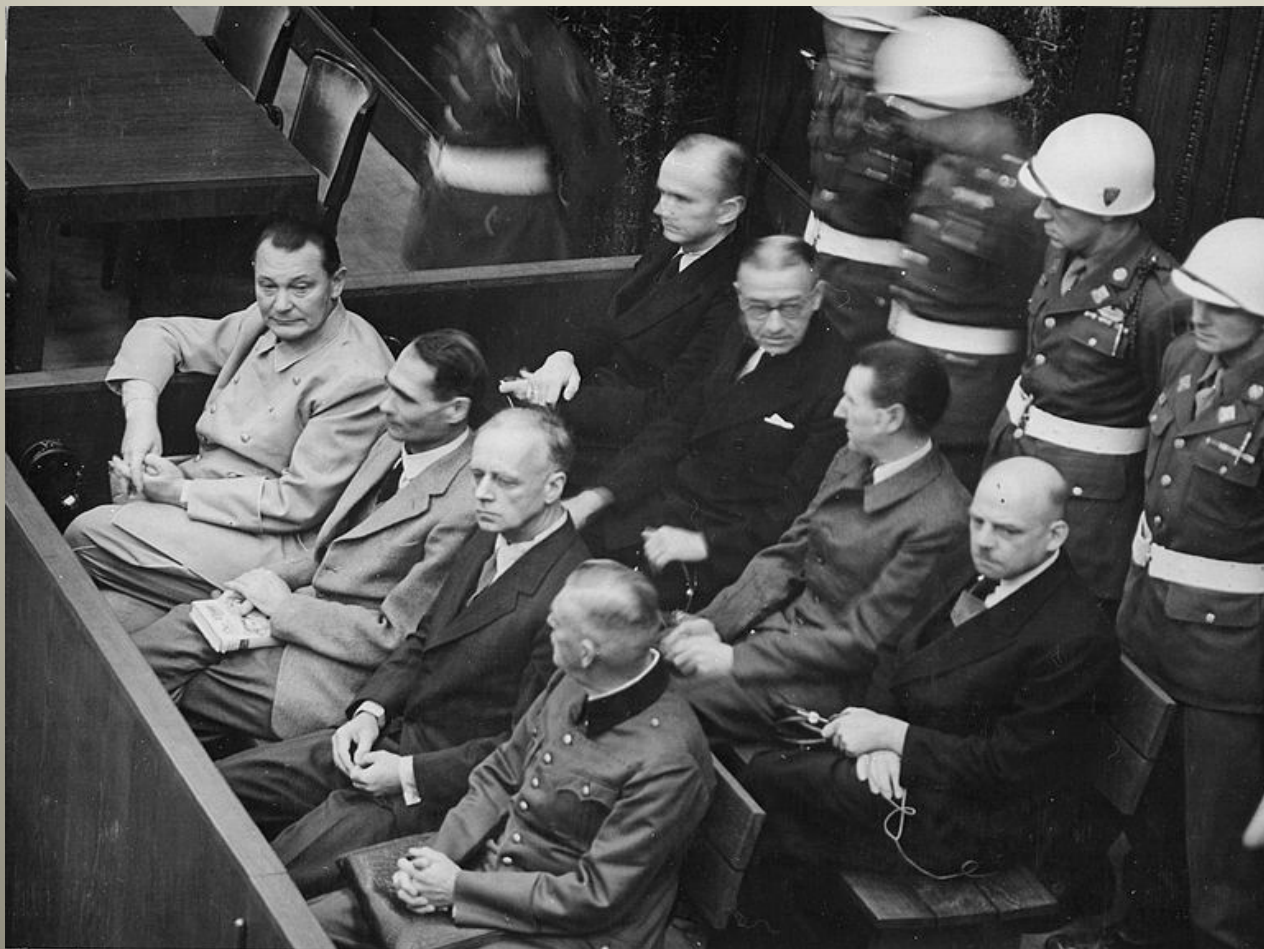
Obrázek č. 6

Lavice obžalovaných – Přední řada: Göring, Hess, von Ribbentrop a Keitel. Druhá řada: Dönitz, Raeder, Schirach a Sauckel.