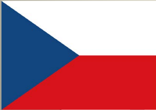
státní vlajka ČSR