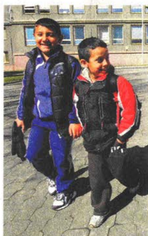
Je dost romských dětí, které do školy nechtějí. Proč?

Také by to české děti mohlo nabádat k tomu, že nebudou chodit do školy, budou požadovat také za povinnou docházku peníze.