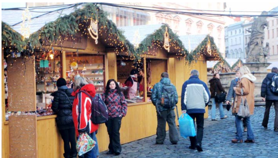
Skvělá atmosféra na vánočních trzích

Již každoročně se v našem krásném městě zvaném Olomouc, které leží v srdci Hané, konají nezapomenutelné vánoční trhy. Ptáte se proč nezapomenutelné? Protože se zde schází mnoho lidí a při předvánoční atmosféře a horkém punči si zde sdělují novinky a poznávají nové lidi. A my tam samozřejmě