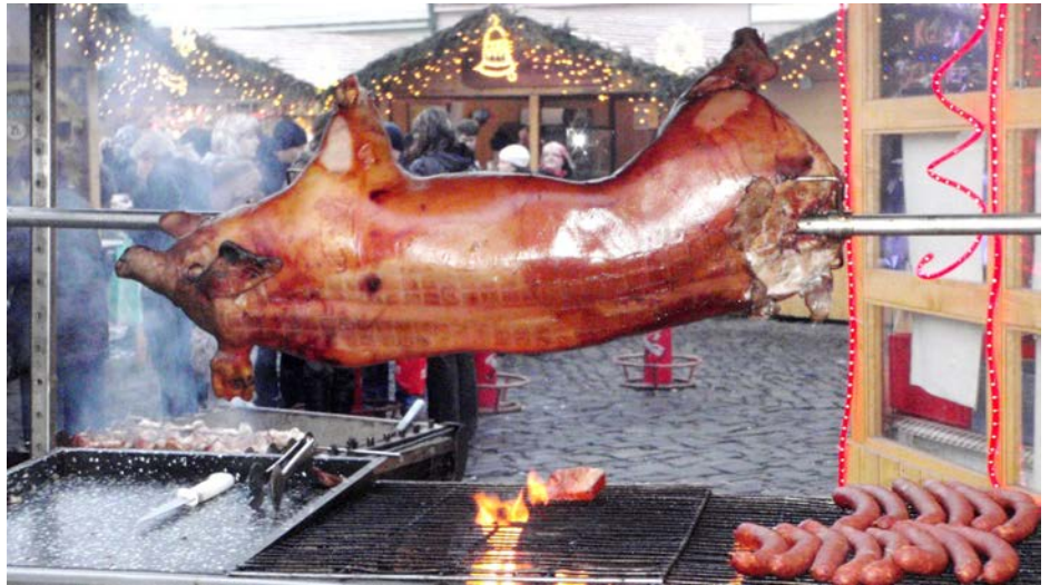
Selátko přijde k chuti po několika punčích

A co já? Mně se sice výlet líbil, což o to, ale zimní počasí nepatří mezi oblíbené, a proto si vánoční atmosféru lépe vychutnám doma, pěkně v teple a ve společnosti mých nejbližších.