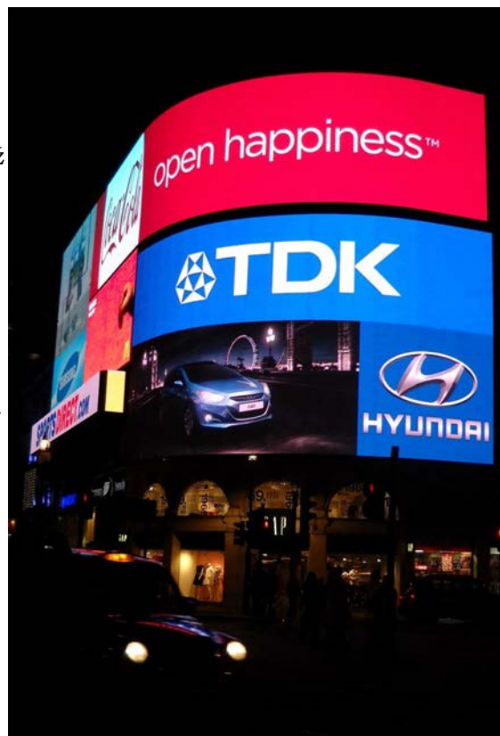
Noční pohled na velkoplošné neónové reklamy na Picadilly Circus