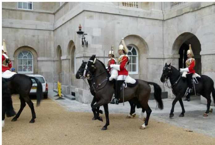
Jízdňí pluk vyjždí z kasáren ke střídání stráží.

svým nabitým peněženkám v místních obchůdcích, kde každý koupil nějaké to tričko, mikinu, kalhoty, nebo alespoň přívěsek na památku, atd. Poté jsme vyrazili na Trafalgar Square. Uprostřed tohoto náměstí stojí na vysokém sloupu národní hrdina admirál Nelson. Ani on se nevyhnul našim cvakajícím fotoaparátům. Následovala návštěva národní galerie, v níž jsme si prohlédli obrazy známých malířských mistrů, jejichž jména i díla zná celý svět - a nyní už i strojaři z Olomouce. Poté jsme měli zajímavou možnost shlédnutí plátna porovnat s díly umělců tvořících nebo alespoň vystavujících na tomto náměstí. Nutno podotknout, že budou muset na své malířské technice ještě více zapracovat, mají-li i jejich obrazy jednou viset v národní galerii a ne pouze na náměstí před ní. Nebyli zde však pouze malíři, ale i hudebníci, nejrůznější kejklíři,