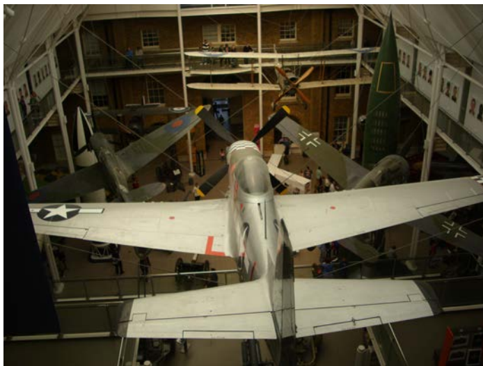
Exponáty Imperiálního válečného muzea.

Pavla. Protože bylo pár minut před zavírací dobou – i duchovní pastýři neradi pracují přesčas – snažili jsme se dostat dovnitř co nejrychleji. Po prohlídce vnitřních prostor přízemní části jsme zahájili výstup do horních částí chrámu. Schodů bylo víc než dost a