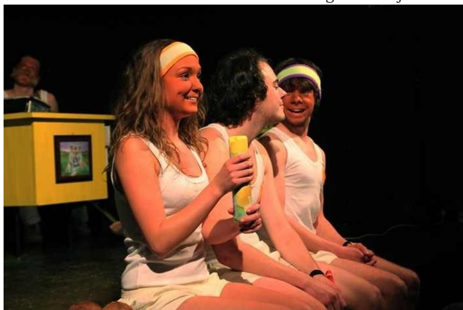
Bára v divadelní hře Tropical Islands .

později projevily v různých recitačních soutěžích. Za úspěchy vděčím své paní učitelce Ivaně Němečkové ze Základní umělecké školy Žerotín v Olomouci, která se mnou měla velkou trpělivost a hodně mě naučila. Po absolventském představení Lidé jsou spokojeni , se kterým jsme postoupili na divadelní