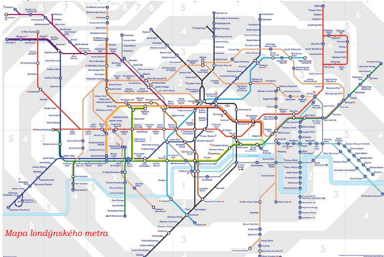
Mapa londýnského metra