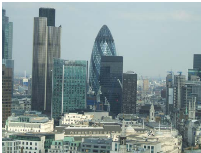
Pohled z katedrály svatého Pavla na čtvrť City of London, včetně markodrapu Swiss Egg.