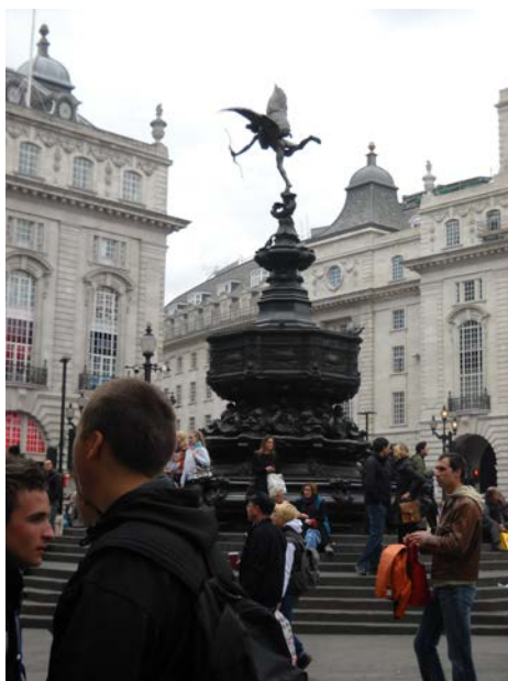
Řecký bůžek lásky Anteros

Picadilly Circus je jedno z nejproslulejších míst v Londýně, které spojuje několik obchodních ulic v městské části Westminster. Označení „circus“ vyplývá z jeho přibližně kruhového