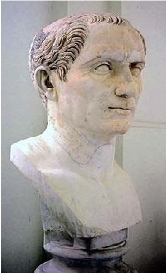
busta Gaia Julia Caesara