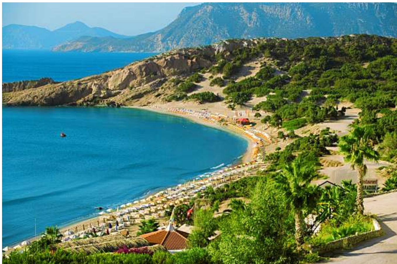
Paradise Beach na ostrově Kós, Řecko.