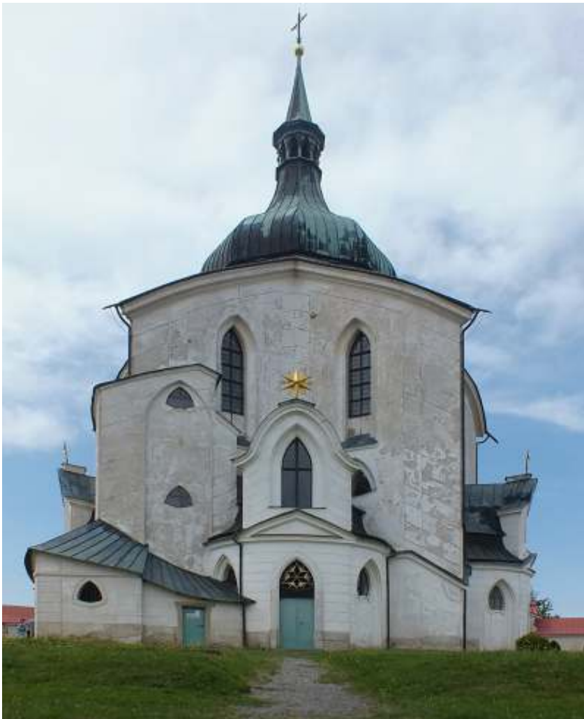
Poutní kostel Hvězda, Žďár nad Sázavou.