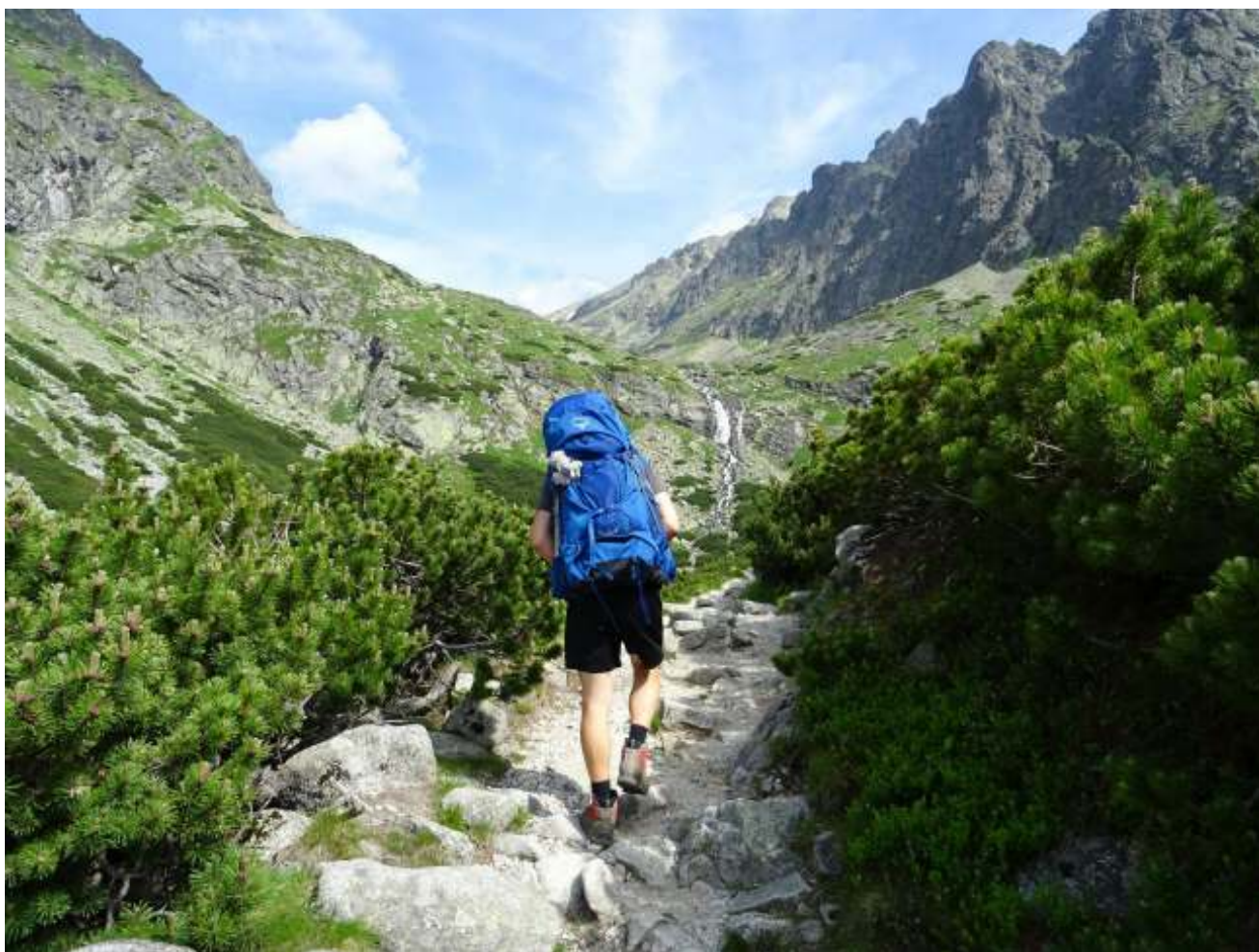
Výstup na Východnou Vysokou ve Vysokých Tatrách.