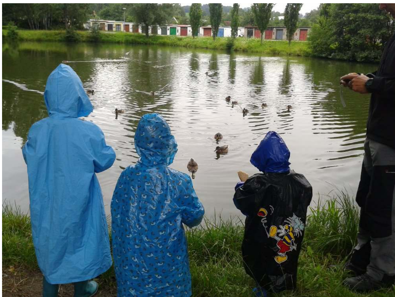
U rybníka v Jeseníku.