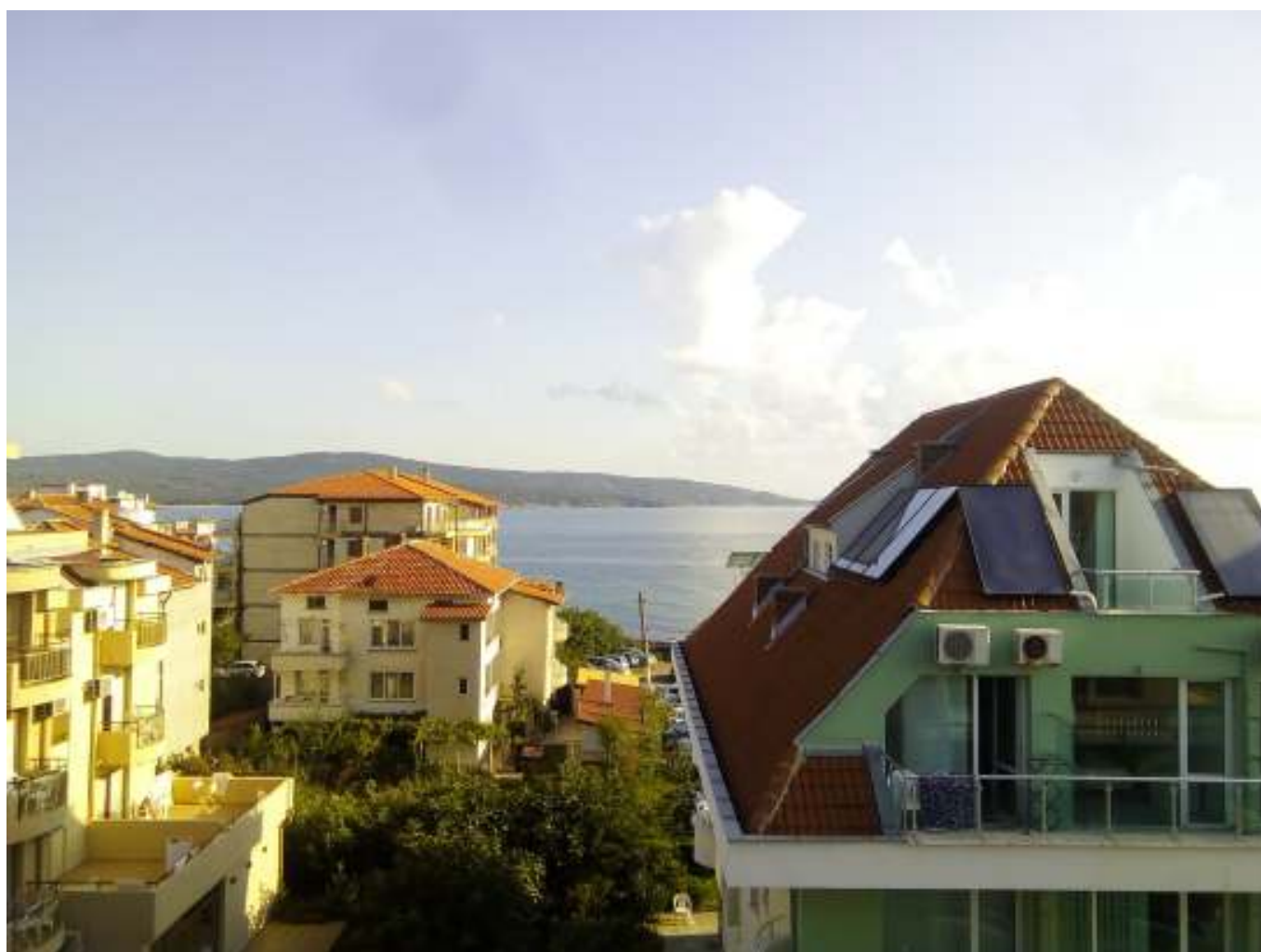
Černé moře v Primorsku, Bulharsko.