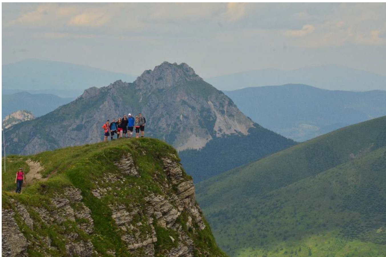
Velký Rozsutec, Malá Fatra.