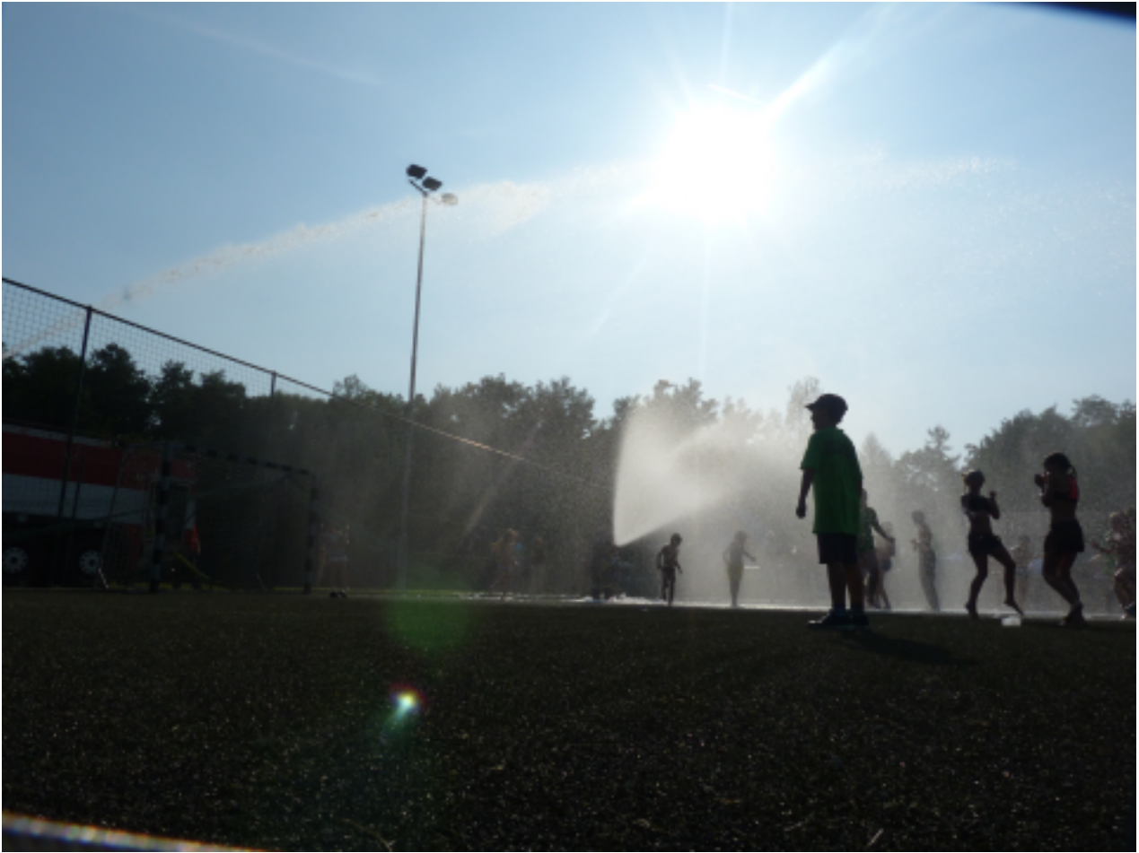
Hasičské cvičení.