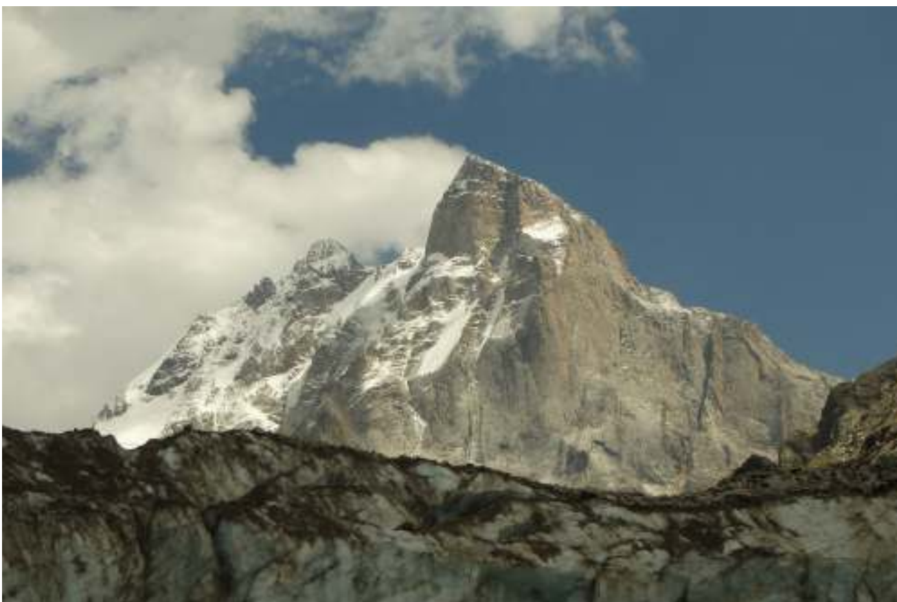
Gruzie, ledovec Schara.