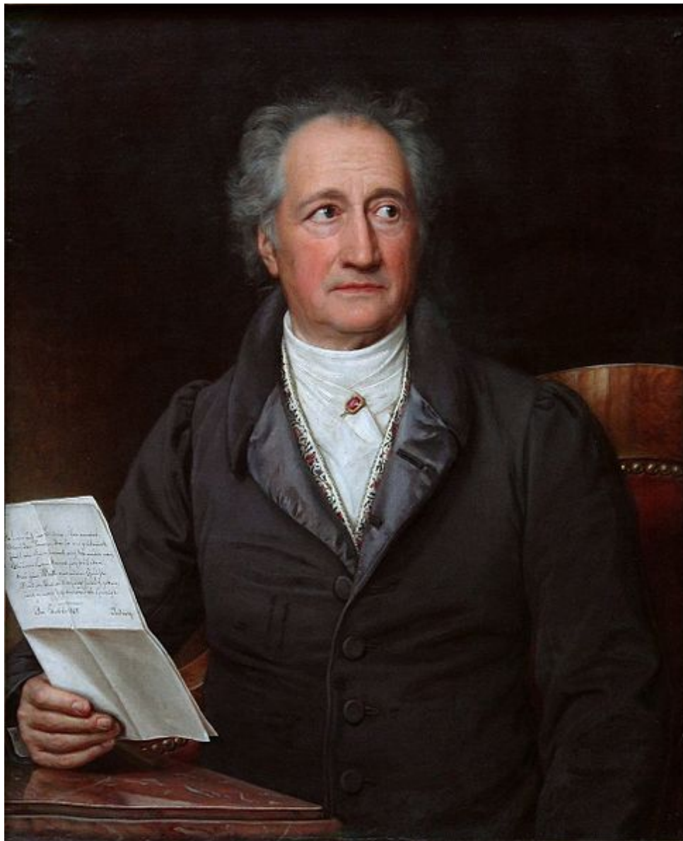
Johann Wolfgang Goethe, portrét z roku 1828