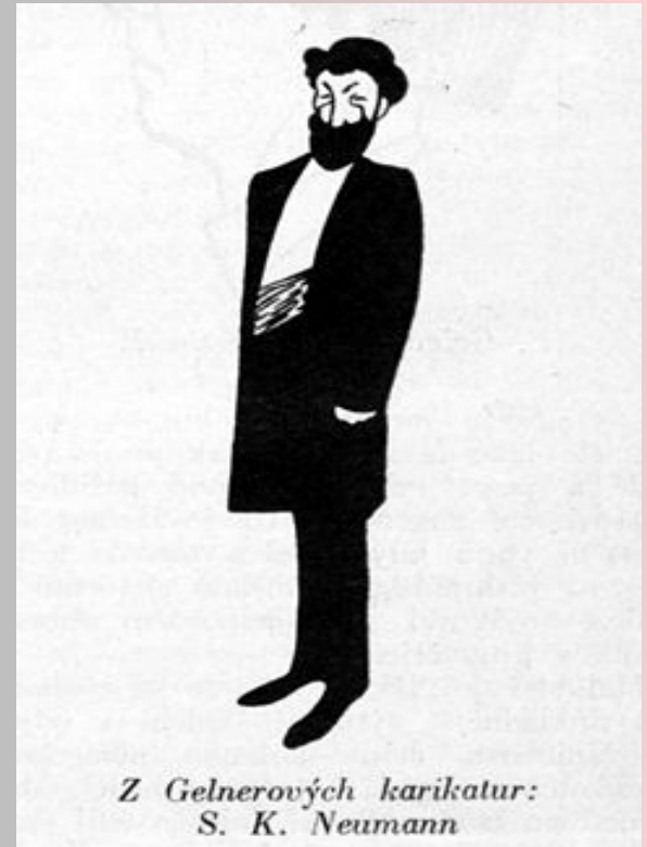
Obrázek č. 1 S. K. Neumann na karikatuře Fr. Gellnera